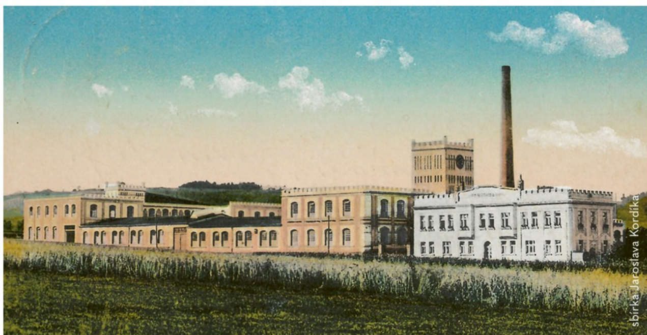
Šlechtova továrna, dvacátá léta 20. století